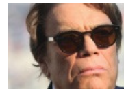
Le patri Ta