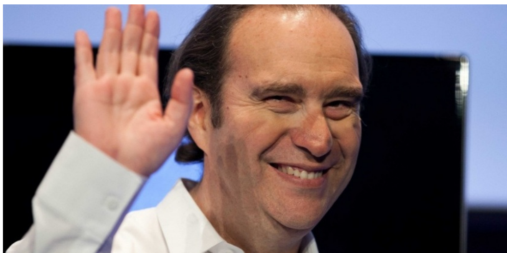
Xavier Niel figure cette année au 10e rang du classement Challenges 500 plus grandes fortunes professionnelles.

330 milliards d'euros. La fortune totale des 500 Français les plus riches a progressé de presque 25 % en un an. De quoi donner le tournis. Et fournir quelques arguments à une France qui a toujours détesté ses riches, surtout en période de crise. Jamais depuis 1996, année où Challenges a lancé son classement des "500", leur fortune globale n'avait atteint de tels sommets.