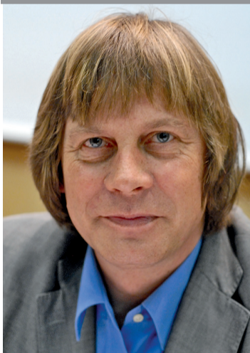
Bernard Thibault, secrétaire général de la CGT

A l'issue d'une négociation laborieuse avec les organisations patronales, un accord a été conclu avec des syndicats de salariés.